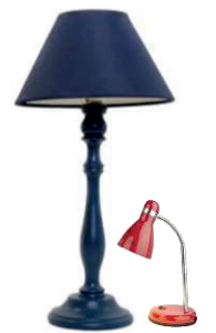
Steh- und Tischleuchte

Glühlampen und Halogenstrahler gehören hingegen weiterhin in den Restmüll.