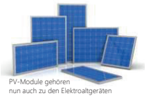
PV-Module gehören nun auch zu den Elektroaltgeräten

Seit dem 1. Februar 2016 können ausgediente Photovoltaik-Module auch bei den Sammelstellen für Elektroaltgeräte abgegeben werden. Es besteht aber auch weiterhin die Möglichkeit PV-Module beim Fachhändler / Installateur zurückzugeben.