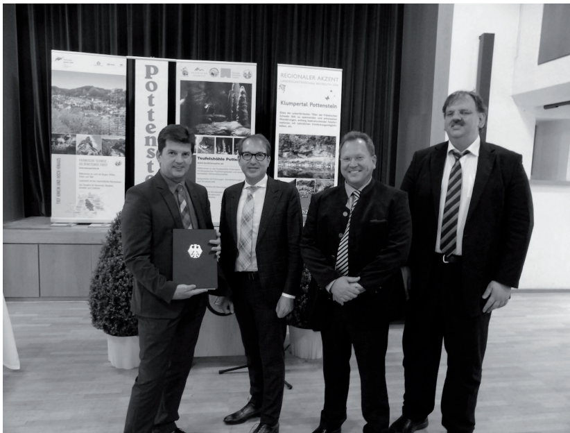
Bundesverkehrsminister Alexander Dobrindt (2.v.l.) bei der feierlichen Übergabe des Förderbescheids an Bürgermeister Stefan Frühbeißer (l.) sowie die beauftragten Planer.

Pottenstein war im bayerischen Förderprogramm, hatte aber schon früh-