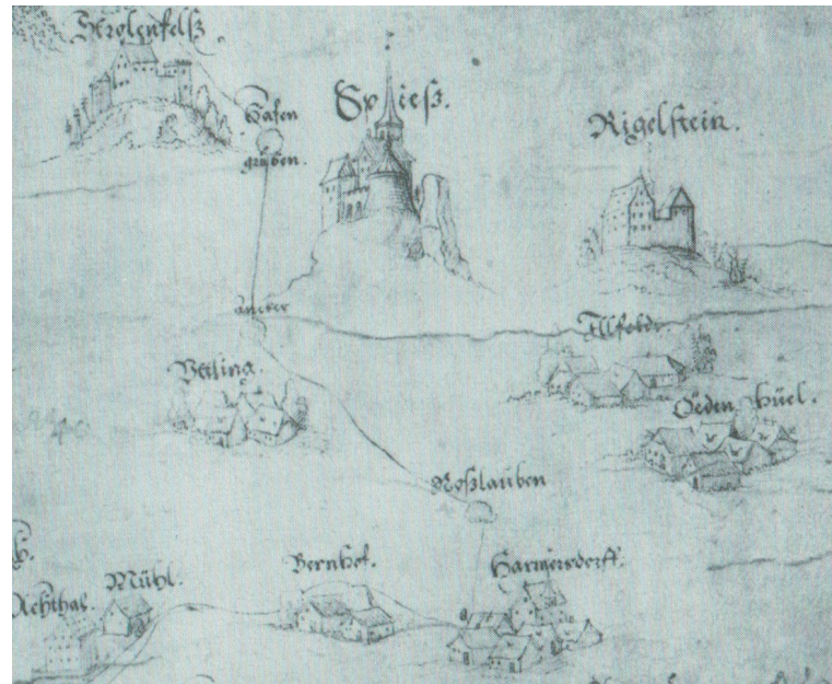
Abb. 1: (oben) Ausschnitt aus der Rothenberger Fraischbeschreibung, in der die Lage der Roslauben sehr genau dargestellt wird; 3