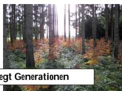
Holz ... bewegt Generationen