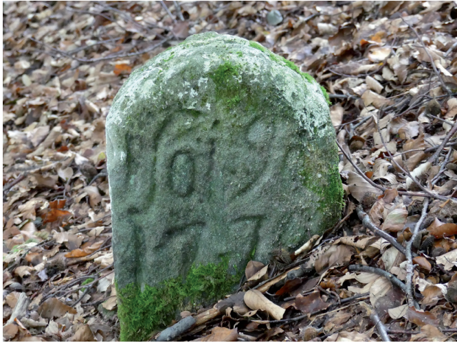
Markstein No.190 aus dem Jahr 1774 am Schweinsberg.

Es handelt sich dabei um Marksteine, die von der Forstbehörde zur Regierungszeit des letzten Markgrafen Carl Alexander gesetzt wurden.