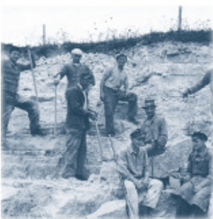
oben: Werksgebäude 2010 kleine Fotos darunter: Putzkalkwerk 1925, Abriss des Turmes 1956, Arbeiter im Steinbruch Weidensees