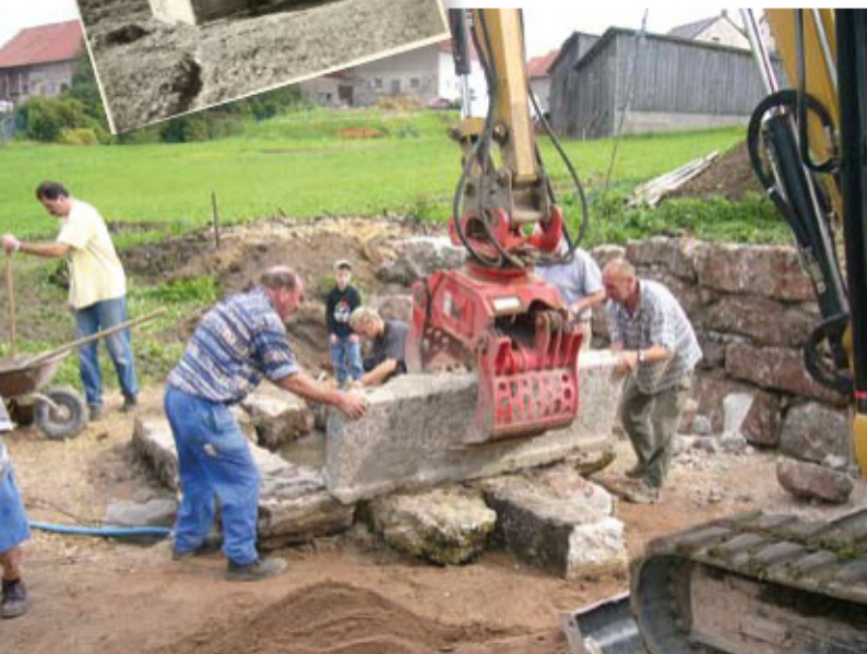
Restaurierung des „Bettelbrunnens“ alte Ansicht (kl. Foto)

bis 1970. Anschließend mussten die Weidenseeser Kinder in die Volksschulen nach Plech und Betzenstein; zum Besuch von weiterführenden Schulen mußten sie nach Pegnitz oder Bayreuth.