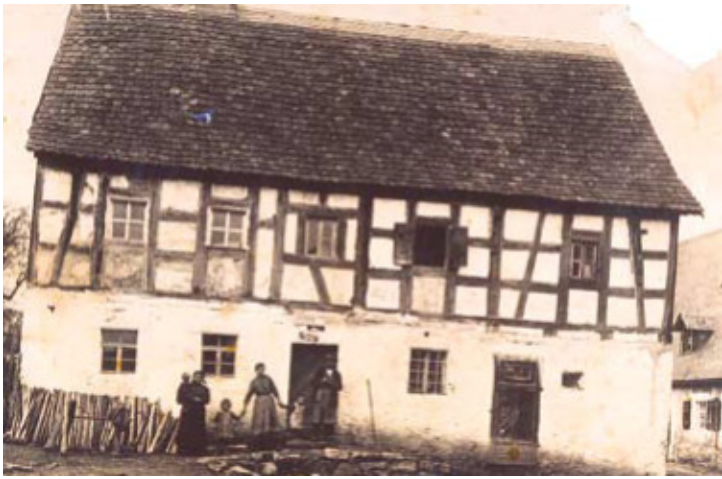
typisches Bauernanwesen der Familie Seibold, Haus-Nr. 26