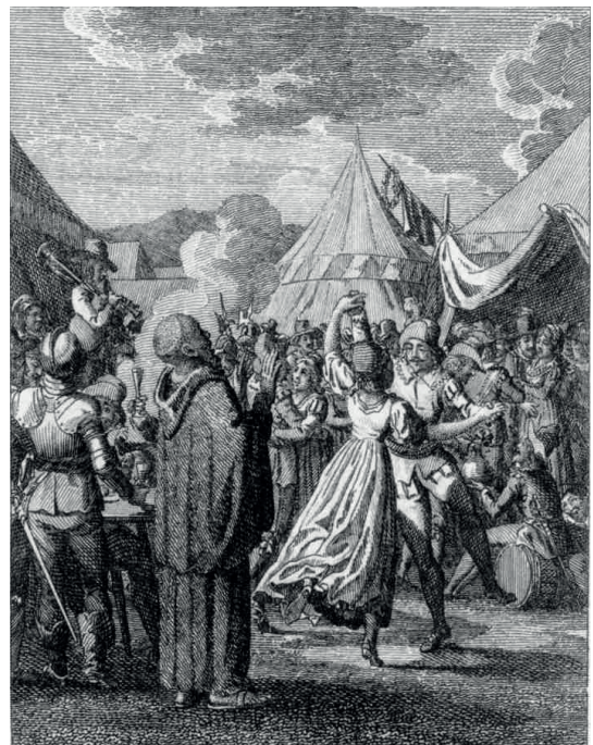
„Ist das eine Armee von Christen? Sind wir Türken, sind wir Antipapstlichen?“

Max Piccolomini ist ein fiktiver Oberst und Sohn des realen Octavio Piccolomini (1599 - 1656). Er diente Wallenstein als kaiserlicher General und als Kommandeur der Leibgarde. 1634 wandte sich Piccolomini aber gegen Wallenstein.