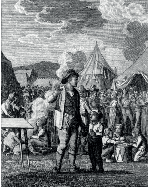
Wallensteins Lager Wie sie jubelten – das Gott erbarm!

Vor 400 Jahren, am 23. Mai, begann mit dem Prager Fenstersturz der Dreißigjährige Krieg (1618-1648).