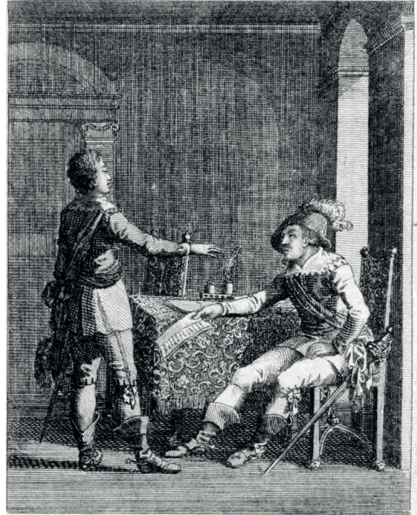
Max: „Noch ehe der Tag sich neigt muß ich erklären „Ob ich den Freund – ob ich den Vater soll entbehren.“

Schillers Personen sind zwar historisch, die Handlung ist jedoch „künstlerisch frei“ gestaltet.