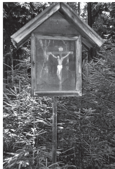
links: Das Dreifaltigkeits- marterl im Velden- steiner Forst.

Die Wallfahrt in Gößweinstein erlebte im 16. Jahrhundert einen besonderen Aufschwung, unter anderem auch durch das Hüller Gnadenbild.