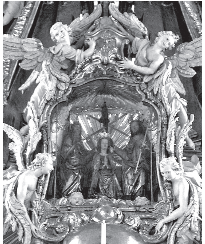
Bild oben: Das Gnadenbild aus der Hüller Wall- fahrtskirche aus dem 16. Jahrhun- dert.

Als das Fuhrwerk, mit der wertvollen Fracht, an der Wallfahrtskirche in Gößweinstein ankam, blieben die Ochsen stehen und wollten nicht mehr ziehen. Man spannte ein zweites Ochsenpaar vor, aber der Wagen blieb stehen. Die Tiere waren nicht dazu zu bewegen, weiterzugehen. Da erkannte man, dass ein höherer Wille das Bild nicht in Bamberg, sondern in Gößweinstein haben wollte, wo es bekanntlich noch heute als Gnadenbild am Hochaltar von Einheimischen, Pilgern und Urlaubern verehrt wird.