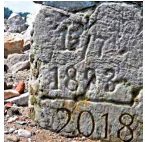
Hungerstein in einem Flussbett

Hungersteine sind natürliche Gesteine, die im Flussbett liegen und nur zu sehen sind, wenn der Wasserstand sehr niedrig ist. Bis heute markiert man durch Eingravieren der Jahreszahl auf dem Stein in Flüssen und Bächen den Wasserstand. [3]