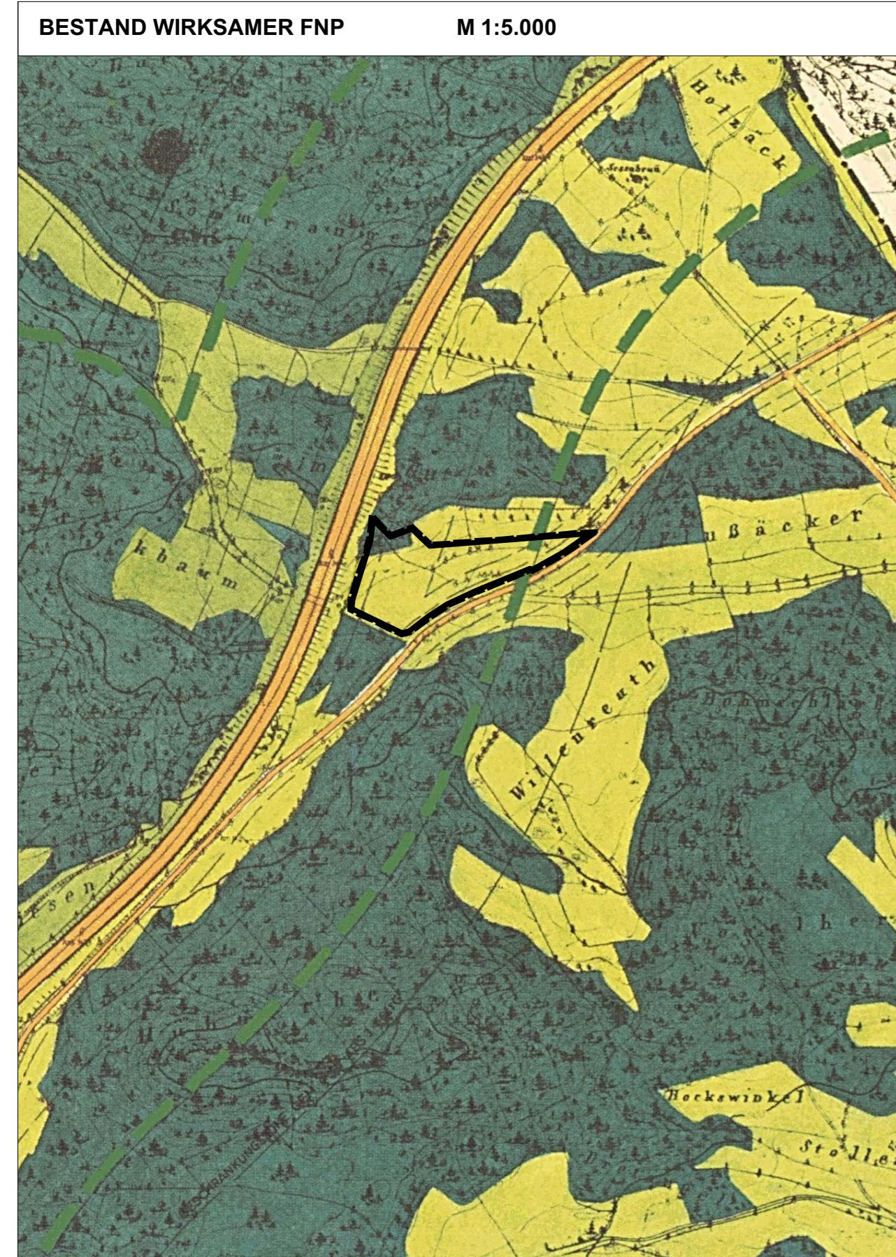
Kartengrundlage: Flächennutzungsplan (Scan)