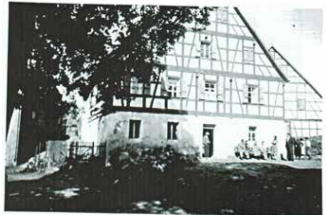
Mit der Wahl des Conrad Funk wurde das Haus Nr. 7 in Eichenstruth zum „Rathaus“. Im Wohnhaus des gewählten Bürgermeisters wurde üblicherweise eine Amtsstube eingerichtet. Lediglich beim Gemeindevorsteher gab es noch ein zusätzliches Amtszimmer.

Die am 1. Juli 1869 bestehenden Gemeinden und Gemeindebezirke werden beibe-