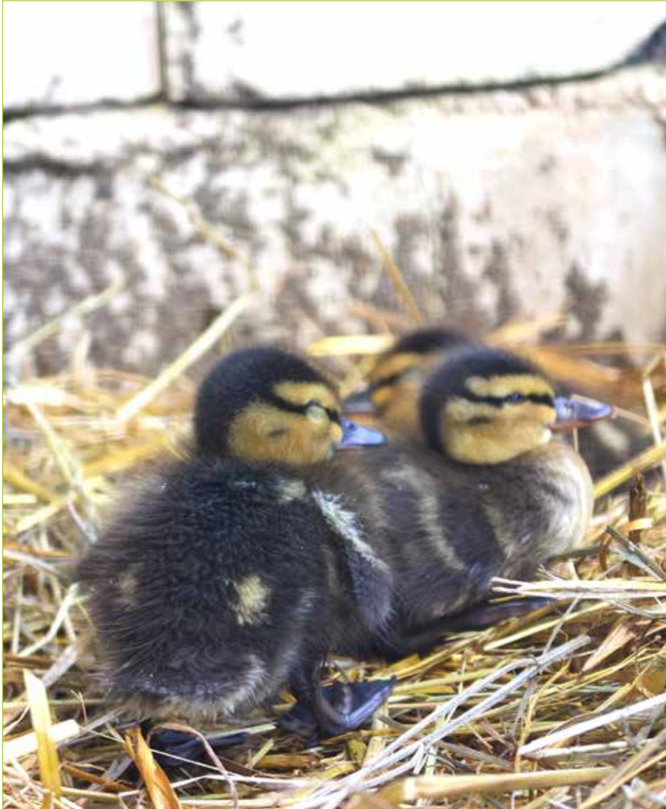
DIE ERSTEN FREIBADBESUCHER