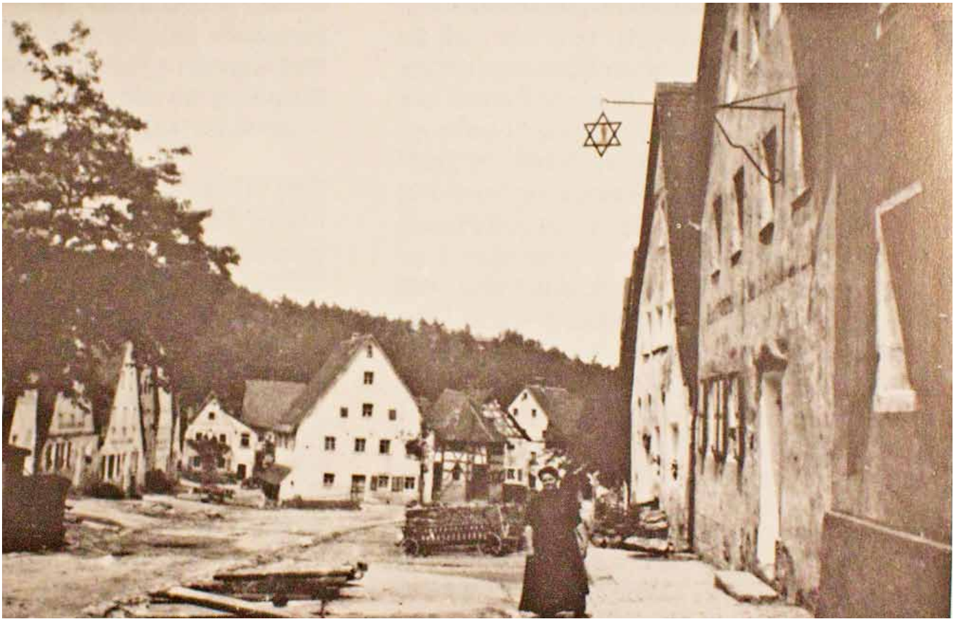
Das alte Foto oben zeigt den Braustern mit dem Stiefel der Heckels an der Fassade des ehemaligen Burgcafés.

Der Braumeister war auch Bürgermeister in Betzenstein, Gründungsmitglied und 1. Vorstand der Wasserversorgung Betzensteingruppe, Initiator des Luitpoldbrunnens* und Vorstand des 1885 gegründeten Männergesangsvereins.