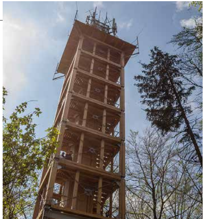
Aussichtsturm auf dem Ossinger

Anmeldungen bis Mittag des Veranstaltungstages unter Tel. 09245-1322 oder monika_boerner@web.de