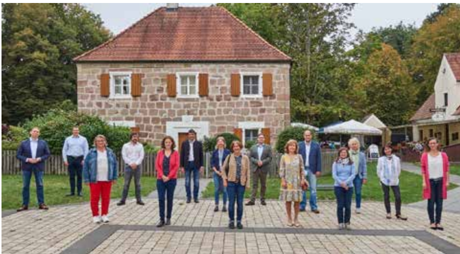
Die Teilnehmer des Arbeitstreffens; Foto: Martin Schmid

Innerhalb der ILE-Regionen wurde viel fachspezifisches Wissen angehäuft. Dieses in einem Netzwerk regelmäßig auszutauschen, drängte sich förmlich auf und die Zielsetzung liegt klar auf der Hand: Voneinander lernen, das Rad nicht immer neu erfinden müssen – dort, wo es gut funktioniert, aber auch da, wo es in der Praxis Probleme gibt. Deshalb wurde auch über aktuelle Themen der Bayerischen Verwaltung für Ländliche Entwicklung, beispielsweise über das neue Regionalbudget, diskutiert. Das Arbeitstreffen soll künftig regelmäßig, das nächste in der ILE Schwarzach-Regen stattfinden.