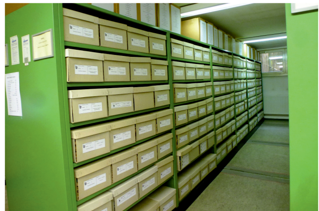
Archivierte Unterlagen im Archiv der Stadt Auerbach

Aktuell sind die beteiligten Gemeinden auf der Suche nach einem Archivar (m/w/d). Die Stellenausschreibung ist auf der Internetseite der Gemeinde Hartenstein zu finden. Bewerbungsfrist ist am Freitag, 29.04.2022.