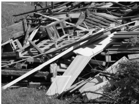
So bitte nicht! Das Verbrennen von Abfällen ist verboten.

Bei der Sammlung von Materialien für das Feuer ist die Versuchung groß, behandeltes Holz und behandelte Holzabfälle (z.B. Böden, Fensterrahmen, Furniermöbelteile, Holzzäune, Spanplatten und Paletten) sowie andere Abfälle (z.B. Dämmstoffe, Reifen, Plastiksäcke und -folien) zur Feuerstelle zu bringen. Daher muss der Veranstalter darauf achten, dass nur unbehandeltes Holz (z.B. direkt aus dem Wald bzw. Abschnittholz aus dem Sägewerk) eingesammelt und verbrannt wird.