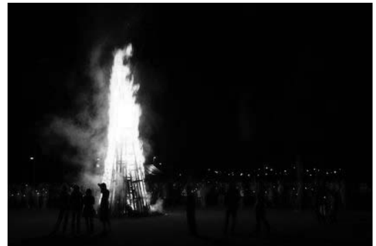
Sonnwendfeuer dienen der Brauchtumpflege und Geselligkeit und nicht der Abfallentsorgung

Leider werden Sonnwendfeuer gelegentlich auch zur Abfallbeseitigung genutzt. So wurden in den vergangenen Jahren beispielsweise lackiertes bzw. imprägniertes Holz, Autoreifen und Möbelteile verbrannt. Durch das Verbrennen dieser Abfälle entstehen gesundheitsschädliche und gefährliche Stoffe. Die Teilnehmer dieser Feste, darunter natürlich auch Kinder, müssen diese Schadstoffe dann einatmen.