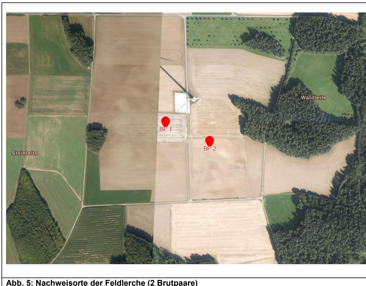
Abb. 5: Nachweisorte der Feldlerche (2 Brutpaare)

Im Vorhabenbereich wurde die gefährdete Feldlerche mit zwei Brutpaaren nachgewiesen (s. Abb. 5, Mittelpunkt des Fortpflanzungshabitat).