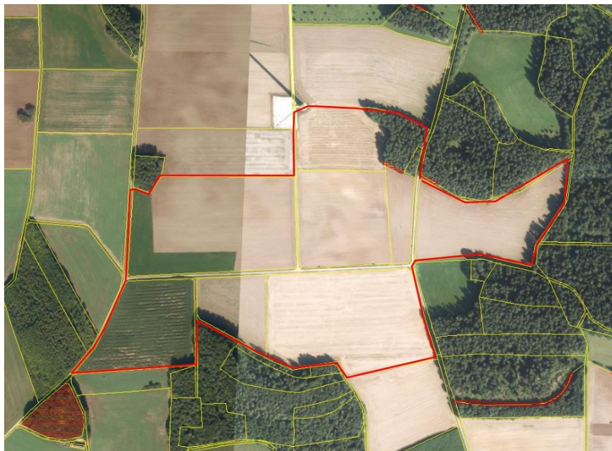
Abb. 1: Lage der Vorhabenfläche im Luftbild