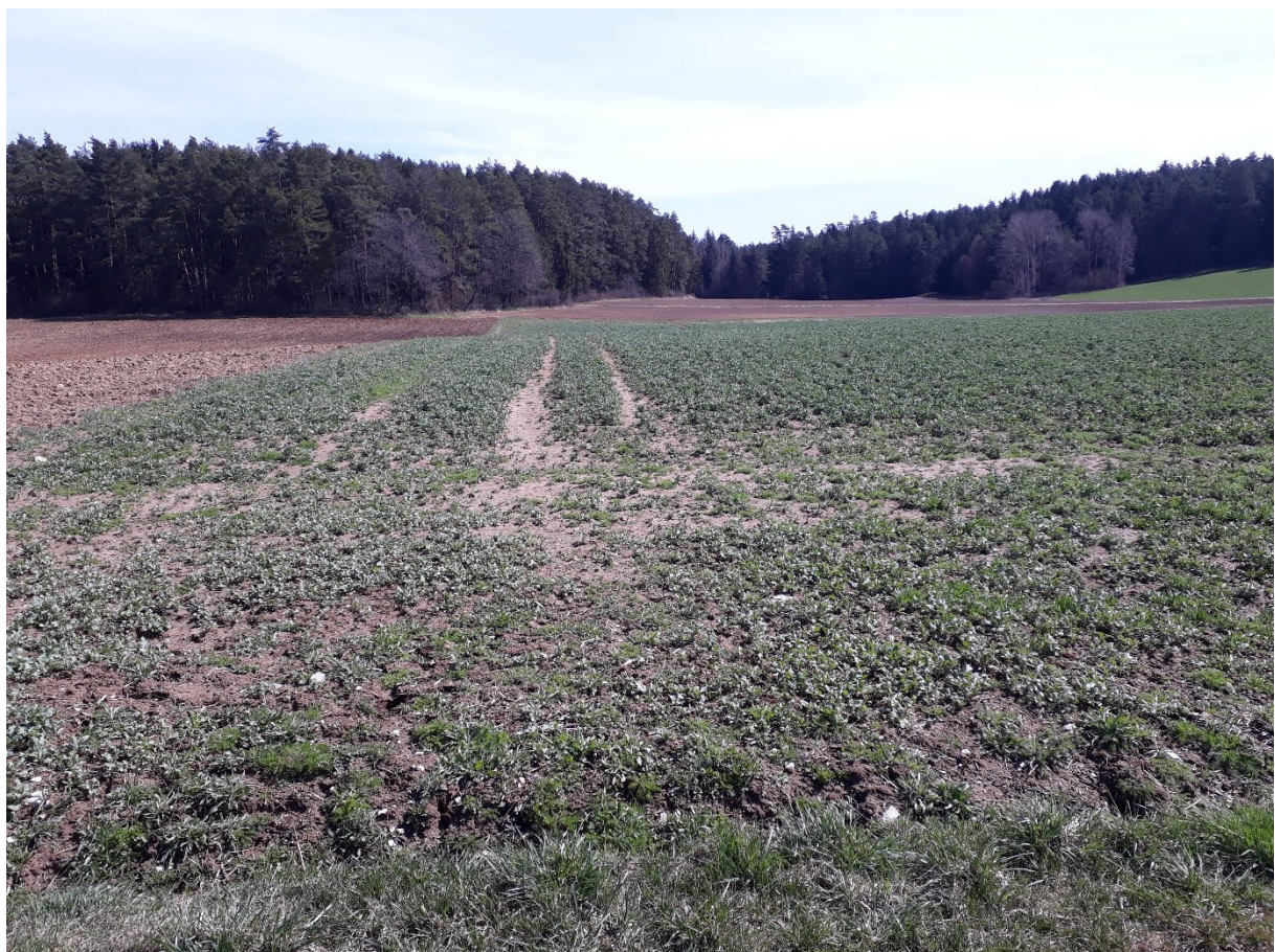
Abb. 2: Vorhabenbereich (Acker); Blickrichtung Ost

Die folgenden Bilder zeigen den Vorhabenbereich ; Aufnahmedatum 12.04.2022 und 4.5.2022, Dr. Gudrun Mühlhofer. Weitere Fotos vom 4.5.2022 befinden sich in Kap. 6.