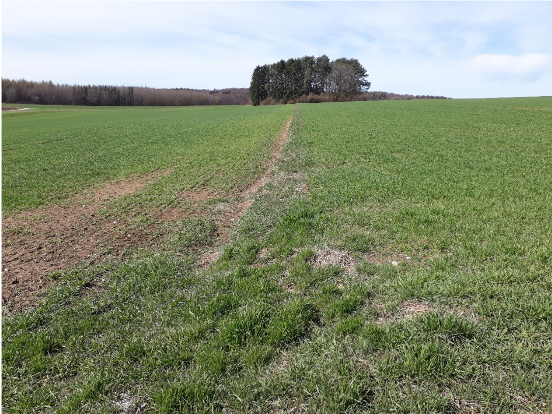
Abb. 3: Vorhabenbereich mit Ackerflächen; Blickrichtung Nord