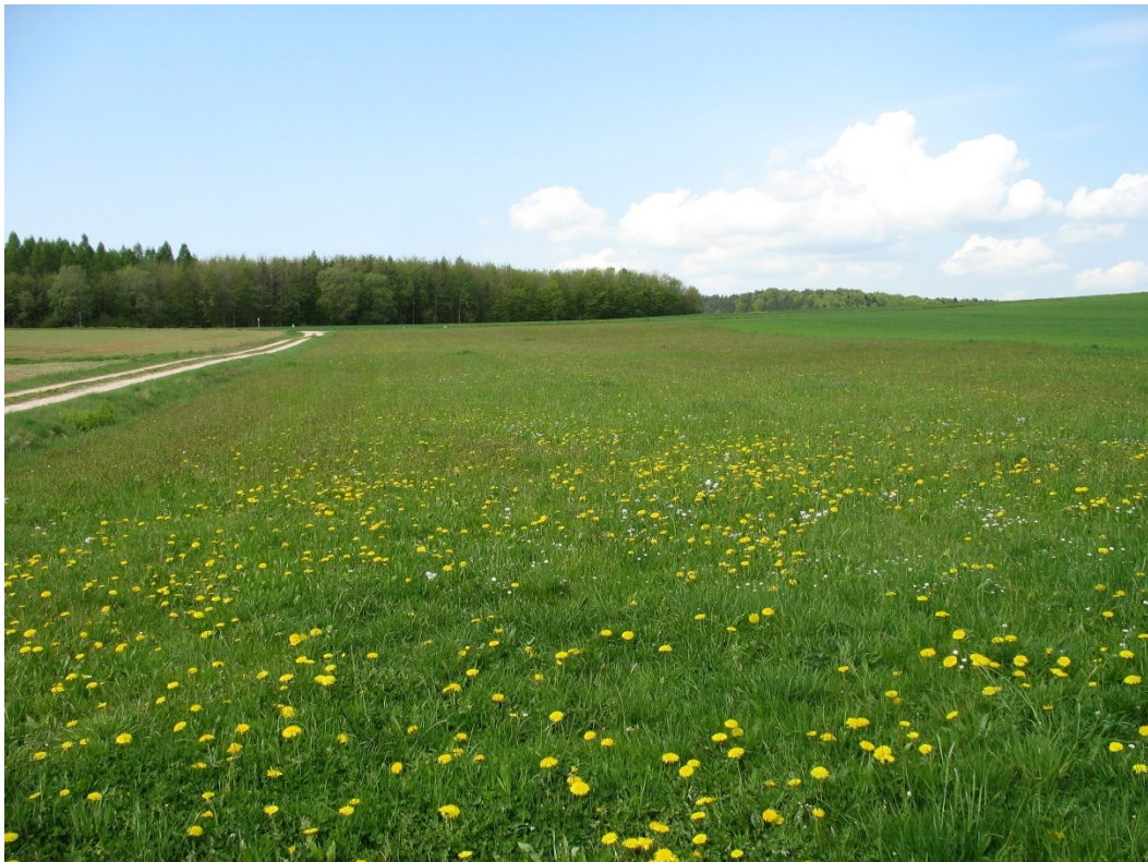
Abb. 4: Vorhabenbereich mit Grünlandstreifen; Blickrichtung West, Datum 4.5.2022.