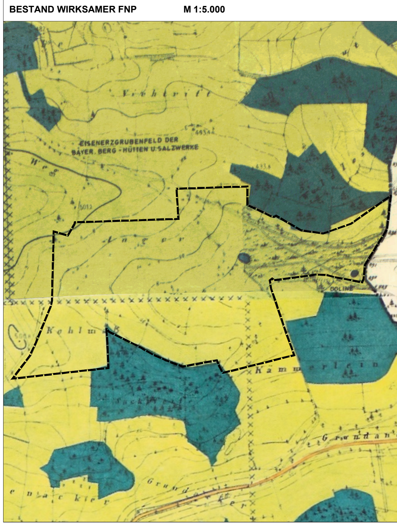
Kartengrundlage: Flächennutzungsplan (Scan)