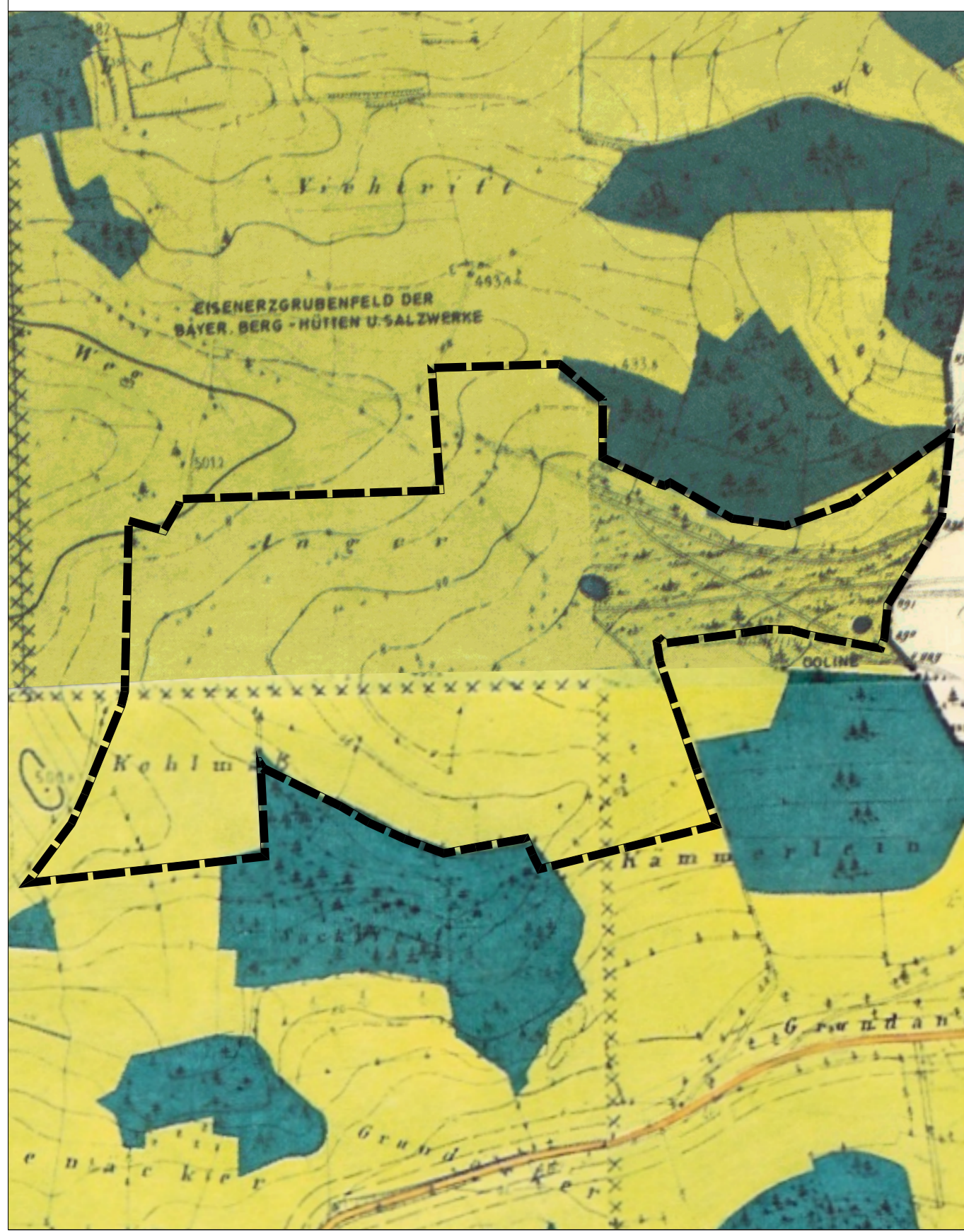
Kartengrundlage: Flächennutzungsplan (Scan)