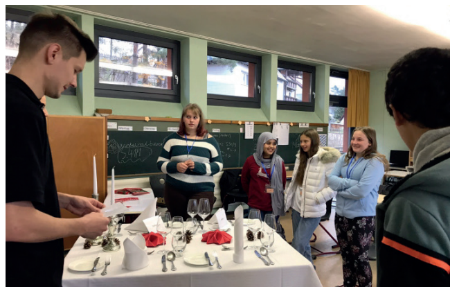
Berufsorientierung ist wichtig – Berufsinftag 2023

Da der AG FrankenPfalz e.V. für die Broschüre mit dem Netzwerk SCHULEWIRTSCHAFT Pegnitz-Auerbach zusammenarbeitet, sind zudem Angebote aus dem Pegnitzer Raum enthalten.