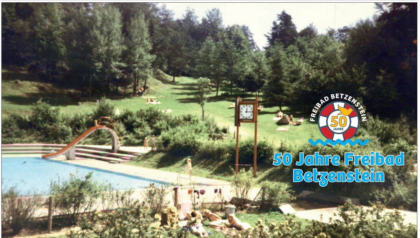
Blick auf die idyllische Liegewiese, 1974