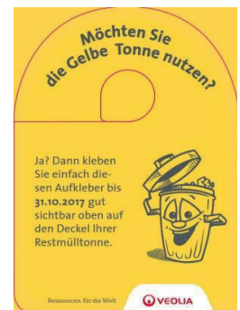
Anhänger mit Aufkleber zur Bestellung der Gelben Tonne

Weitere detaillierte Auskünfte sind unter www.landkreis-bayreuth.de/gelbetonne oder den Servicenummern 0800 / 07 85 600 (kostenlos) sowie 0921 / 93 05 851 erhältlich.