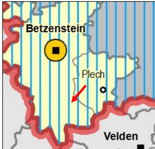
Abb. 1: Ausschnitt RP Oberfranken-Ost – Karte 1: Raumstruktur

Landschaftspflege besonderes Gewicht zu (B.I.2). Das Gebiet liegt außerdem innerhalb eines festgesetzten Landschaftsschutzgebietes (vgl. hierzu Kapitel „Schutzgebiete Naturschutz- und Wasserrecht“).