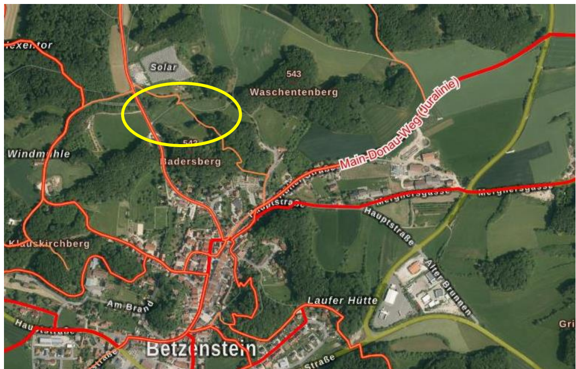
Wanderwege (rote und orange Linien) im Verfahrensgebiet (gelber Kreis) (Quelle: BayernAtlas, unmaßstäblich)

Eine fußläufige Verbindung zum Ort Betzenstein mit seinen Einkaufsmöglichkeiten, der Gastronomie und weiteren Erholungseinrichtungen ist über die bestehenden Wanderwege gesichert.