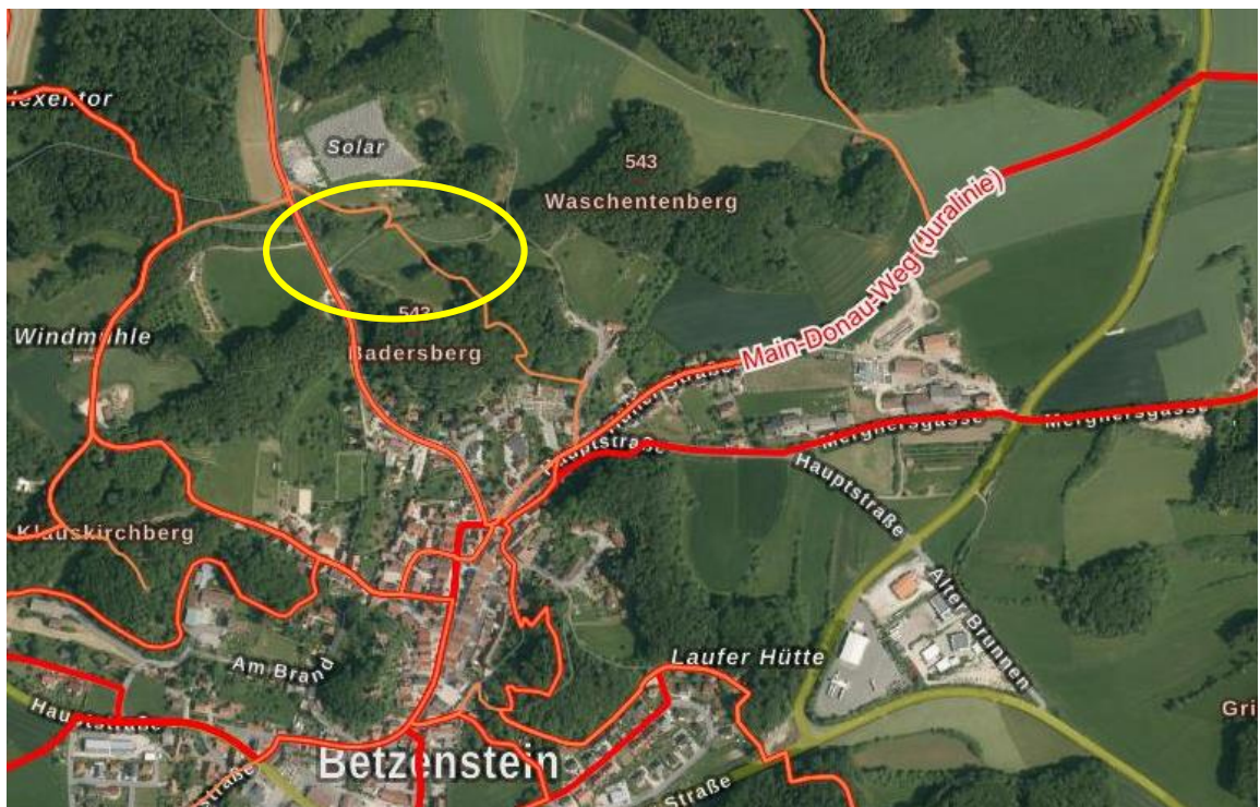
Wanderwege (rote und orange Linien) im Verfahrensgebiet (gelber Kreis) (Quelle: BayernAtlas, unmaßstäblich)

Eine fußläufige Verbindung zum Ort Betzenstein mit seinen Einkaufsmöglichkeiten, der Gastronomie und weiteren Erholungseinrichtungen ist über die bestehenden Wanderwege gesichert.