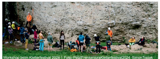
Workshop beim Kletterfestival 2024

Ein satirisches Theaterstück von Markus Böse Freitag, 05.06.2026 und 12.06.2026, 19:00 Uhr Samstag, 06.06.2026 und 13.06.2026, 19:00 Uhr Sonntag, 07.06.2026 und 14.06.2026, 16:00 Uhr Freilichtbühne, Schlossberg in Spies