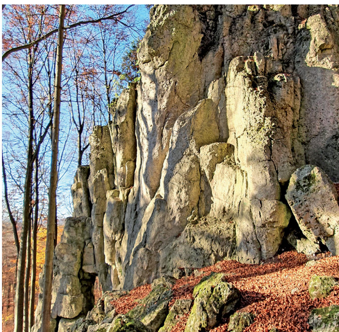
Foto: Felsenriff am Fuchsweg