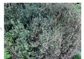
Vom Buchsbaumzünsler befallener Buchs

Nähere Infos erhalten Sie bei Ihrer Abfallberatung unter den untenstehenden Kontaktdaten.